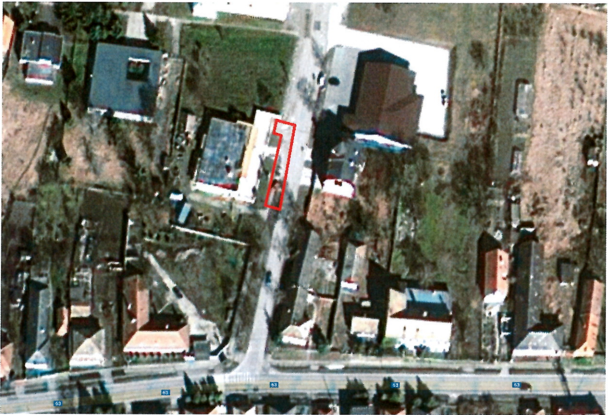
Vyznačená plocha pred reštauráciou Biely Kôň