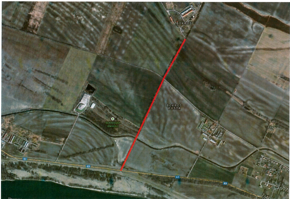
Vyznačená cesta na Bokroš